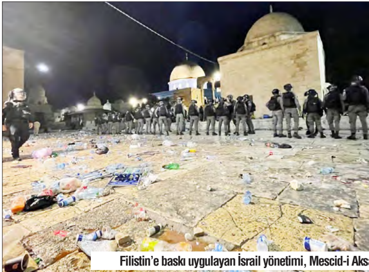
Filistin'e baskı uygulayan İsrail yönetimi, Mescid-i Aksa'da Müslümanların ibadet hakkını elinden almaya çalışıyor