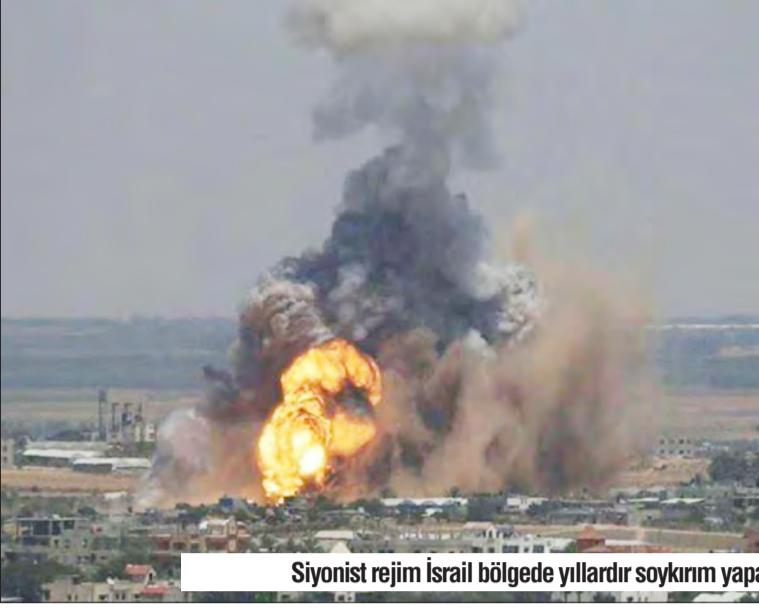
Siyonist rejim İsrail bölgede yıllardır soykırım yaparak, çocuklar başta olmak üzere, binlerce cana kıydı.