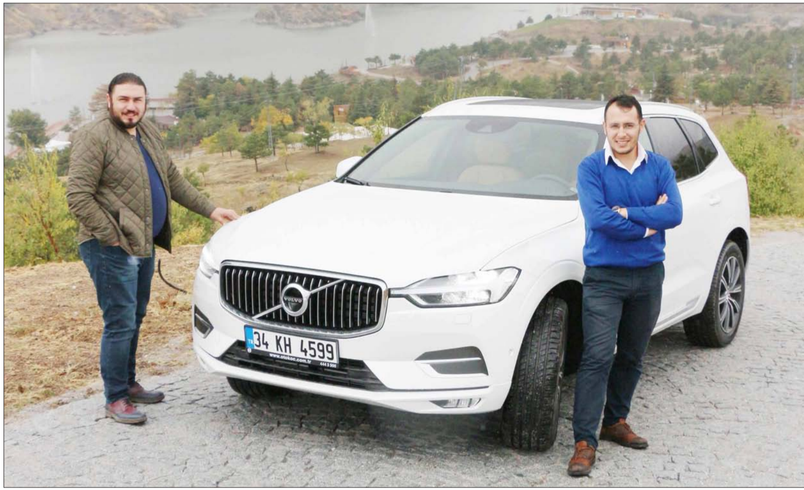
Güzel görünümü, kolay kullanımı ve duygularını harekete geçirecek tasarımı ile yeni Volvo XC60'ı sizlerle tanıştıyoruz.

Volvo XC60'ın tüm detaylarında insani ve doğadan bir parça görebiliyorsunuz. Doğal etkileşim yolları ile aracınıza hükmedebiliyorsunuz. Bu da onu görkemli ve heybetli duruşu kadar zarif ve kullanışlı hale getirmiştir.