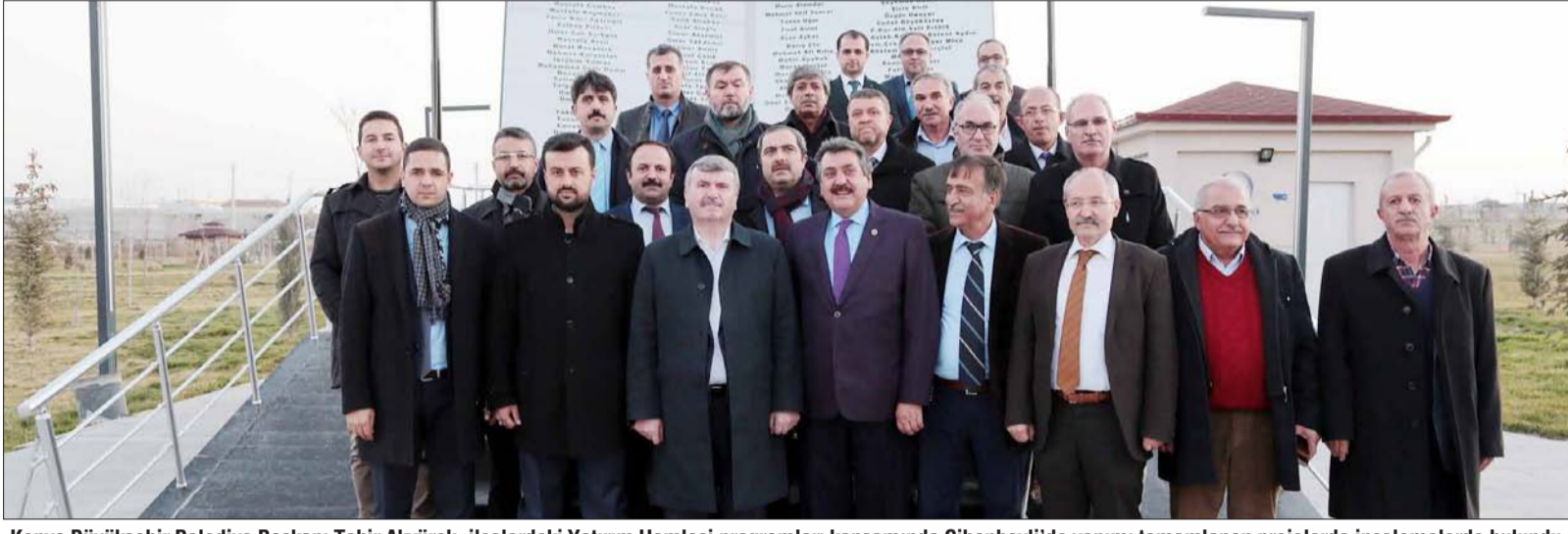
Konya Büyükşehir Belediye Başkanı Tahir Akyürek, ilçelerdeki Yatırım Hamlesi programları kapsamında Cihanbeyli'de yapılmış projelerde incelemelerde bulundu.

Büyükşehir Belediyesi tarafından Mehmet Akif Caddesi ve Fatih Sultan Mehmet Caddesi'nde yapılan prestij cadde düzenlemelerini inceleyen Başkan Akyürek, Cihanbeyli'ye yaklaşık 7,5 milyon lira harcayarak andezi kaldırmıyla, birinci sınıf asfaltıyla altyapısı ve üstyapısıyla prestij caddeler kazandırdıklarını söyledi. Cihanbeyli'nin çok geniş bir coğrafyaya hitap ettiği için buna göre planlama yaptıklarını aktaran Başkan