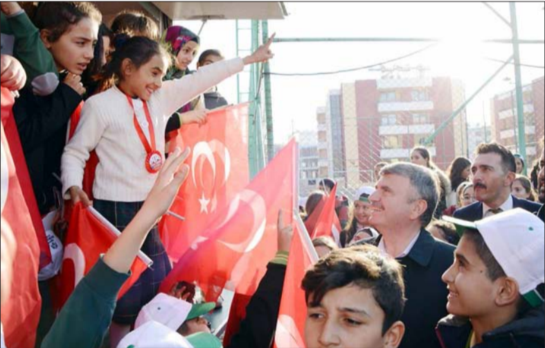
Büyükşehir Belediye Başkanı Tahir Akyürek, bir dizi inceleme ve açılış için gittiği Cihanbeyli'de vatandaşlarla bir araya gelerek sohbet etti. Başkan Akyürek'e Cihanbeylilerin ilgisi yoğun oldu.

Cihanbeyli Belediye Başkanı Mehmet Kale, hemşerilerinin çok daha fazlasını hak ettiğini ve yatırımların devamını geleceğini belirterek, desteklerinden dolayı Büyükşehir Belediye Başkanı Tahir Akyürek'e teşekkür etti. ■ HABER MERKEZİ