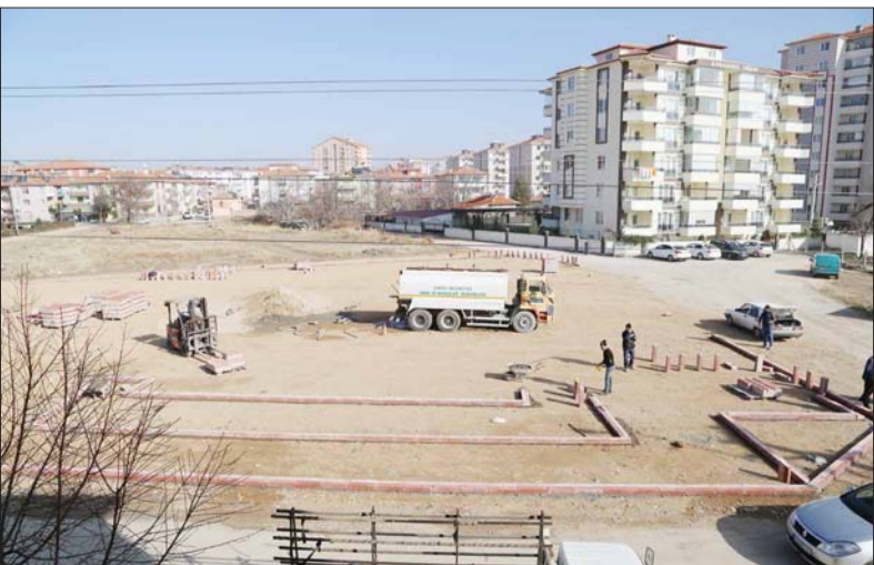
Ereğli Belediyesi'nden anlamlı bir hizmet daha Engelsiz Yaşam Parkı çalışmaları başladı. Ereğli Belediye Başkanı Özkan Özgüven çalışmalarını yerinde inceledi.

luluk Sınavına katılmak isteyen 9-10 ve 11 sınıf öğrencileri online başvuruyu www.yalcinogretimkurslari.com adresine yapacaklardır. Yalçın Özel Öğretim Kursları bursluluk sınavına ilimizde eğitim öğretim gören tüm okulların 9-10 ve 11 sınıf öğrencileri katılabilecektir. Katılmak isteyen öğrencilerin bir an önce online başvurularını yapmalarını gerekmektedir. Bursluluk sınavında başarılı olan öğrenciler Yalçın Özel Öğretim Kursları tarafından belirlenen bursları kazanarak eğitim alacaklardır. Bursluluk sınavına katılacak olan öğrenciler en geç online başvurularını 5 Ocak 2018 Cuma gününe kadar yapmalarını gerekmektedir. ■ HABER MERKEZİ