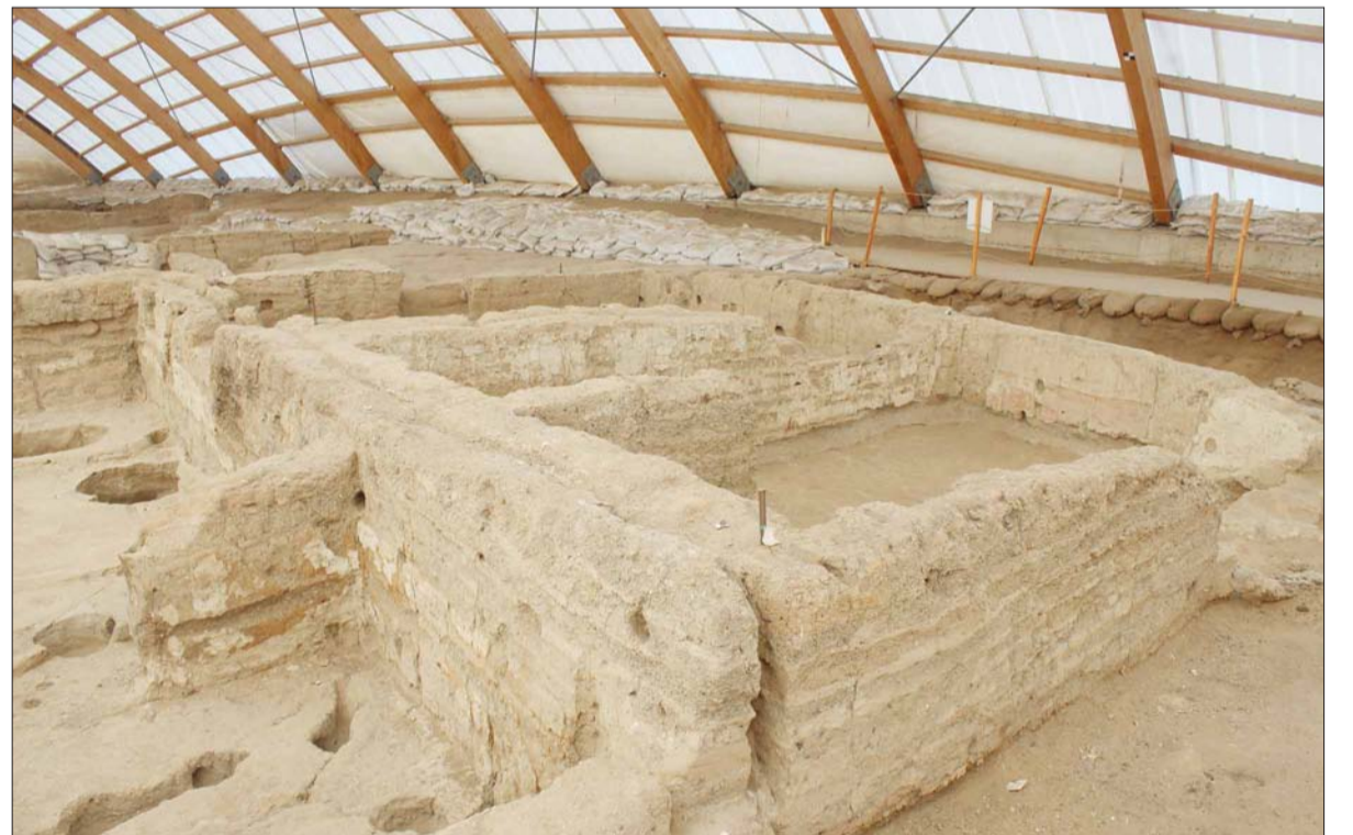
Çatalhöyük'ün yapılan araştırmalarda 9 bin 500 yıllık geçmişi olan yaklaşık 8 bin insanı barındırmış geniş bir neolitik kasaba olduğu ortaya konmuştur.

duvar resimleri yanında orijinal boğa başı, koç başı ve gevik başlarının sıkıştırılmış kil ile konserve edilmiş trofeleri duvarlara applike edilmiş şekilde ortaya çıkarıldı. Bunların yanında rölyef ha-