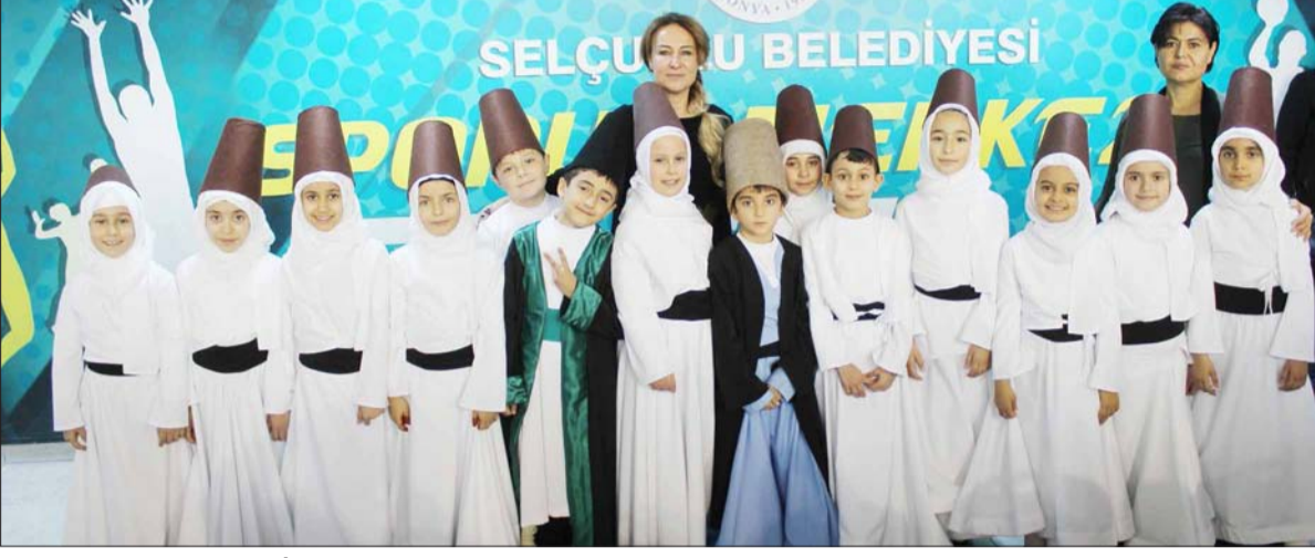
Mustafa Karacığın İlkokulu anasını ve 3. sınıf öğrencilerinin düzenlediği sema gösterisi, beğeniyle izlendi.

Biliyorsunuz, bu yıl Hz. Mevlana'nın vuslatının 744. yıldönümü. Hz. Mevlana'nın şehri olan Konya'da her yıl uluslararası çeşitli etkinlikler dü-