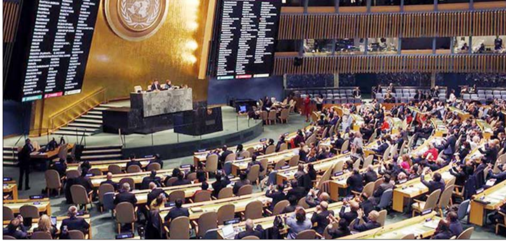
BM Genel Kurulu, Türkiye'nin girişimleriyle hazırlanan ve Trump'ın Kudüs kararını eleştiren Kudüs'ün statüsüne ilişkin "İsrail'in İşgal Altındaki Doğu Kudüs ve Filistin Topraklarındaki Faaliyetleri" başlıklı karar tasarısını oylamak üzere özel oturumla toplandı. Genel Kurul'da ABD'nin Kudüs kararına veto çıktı.

ABD ve İsrail'in yanı sıra, sadece Guatemala, Honduras, Marshall Adaları, Mikronezya, Nauru, Togo ve Palau tasarıya karşı oy kullandı. Bunun yanı sıra Avustralya, Antigua-Barbuda, Arjantin, Bahama Adaları, Benin, Butan, Bosna Hersek, Kanada, Hırvatistan, Çekya, Dominikler, Ekvador, Ginesi, Fiji, Haiti, Jamaika, Letonya, Lesoto, Kamerun, Kolombiya, Kiribati, Malavi, Macaristan, Meksika, Panama, Paraguay, Filipinler, Polonya, Romanya, Ruanda, Solomon Adaları, Güney Sudan, Trinidad Tobago, Tuvalu, Uganda ve Vanuatu ise oylamada çekimser kaldı. BM Güvenlik Konseyi'nden 1967'den 2016'ya kadar geçmiş 10 karar'a atf yapan tasarıda, ABD Başkanı Donald Trump'ın Kudüs'ü İsrail'in başkenti olarak ilan etmesi ve ABD'nin Tel Aviv Büyükelçiliğini Kudüs'e taşımasına ilişkin kararına atıfta bulunarak "Kudüs'ün statüsüne ilişkin son kararlara yönelik derin teessüfte" bulunuldu. Tasarıda BMGK kararlarına da atıf yapılarak, Kudüs'ün "ruhani, dini ve kültürel boyutlarının" korunması gerektiği ifade edilirken, Kudüs'ün sta-