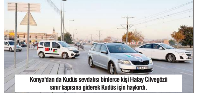
Konya'dan da Kudüs sevdalısı binlerce kişi Hatay Cilvegözü sınır kapısına giderek Kudüs için haykırdı.