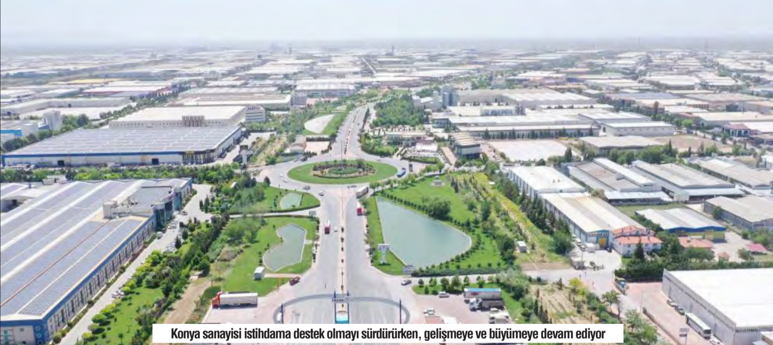
Konya sanayisi istihdama destek olmayı sürdürürken, gelişmeye ve büyümeye devam ediyor