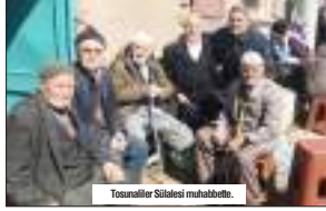
Tosunallar Sülalesi muhabbeti.