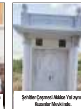
Şehitler Çeşmesi Akköy 10. yıl aynı kuzanlar mevkiinde.