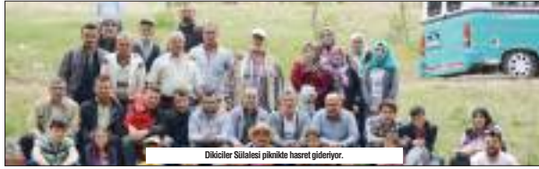
Dikiciler Sülalesi piknikte hasret gösteriyor.

Konya ve bölgesi (MS 395) yılında Bizans İmparatorluğu'nun tanınmış ve önemli merkezleri arasına girmiştir. Mahallemin doğusunda bulunan Aşağı May mevkiinde Büyük Hüyük ve Küçük Hüyük'teki tarihi kalıntılar, bölgenin önemini gözler önüne sermektedir. Rivayetlere göre, 1071 de Malazgirt Savaşı ile Anadolu'nun Türklerin eline geçmesi üzerine Türk boyları akın akın Anadolu'ya gelmeye ve yerleşmeye başladılar. Kayı Türklerinden bir boy da, tarihi Konya - Antalya ulaşım yolunu