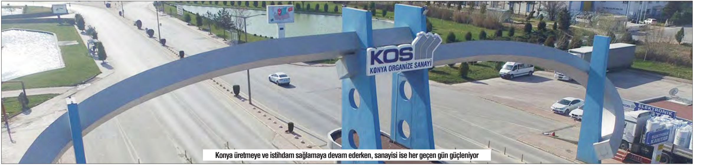
Konya üretmeye ve istihdam sağlamaya devam ederken, sanayisi ise her geçen gün güçleniyor

mızın ardından İkinci 500 Büyük Sanayi Kuruluşları listesine giren 18 firmamız Konya'nın üretkenlik ve girişimcilik ruhunun en güzel göstergesidir. Konya, sanayi ve ticaretteki bu başarıyla ülkemizin ekonomik büyümesine önemli katkı sunmaya devam ediyor. Her geçen gün büyümesini sürdüren şehrimizin gelecekte de bu tür başarılarla anılmaya devam edeceğine inanım tamdır. Bu başarıların sürdürülebilir olması için şehri yönetenler olarak bizler de her türlü desteği sağlamaya devam edeceğiz. ISO İkinci 500 listesine giren tüm Konyalı firmalarımızı ve çalışanlarımızı tebrik ediyor, başarılarının daim olmasını diliyorum." HABER MERKEZİ