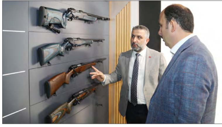
ÖRNEK İŞLETME MODELİ VAR İlçe ve mahalle ziyaretleri

yükselir Belediye Başkanı Uğur İbrahim Altay, Beyşehir'e bağlı Huğlu Mahallesi'nde ziyaretlerde bulunarak vatandaşlarla buluştu. İlk olarak Huğlu Av Tüfekleri Kooperatifi'ni ziyaret ederek, Kooperatif Başkanı Naci Tanık ve çalışanlarla bir araya gelen Başkan Altay, inceleme esnasında kooperatife gelen Huğlu Selçuklu Meslek Yüksekokulu öğrencileriyle de sohbet etti. Huğlu Av Tüfekleri Kooperatifi Tekstil Atölyesi'nde incelemelerde de bulunan Başkan Altay daha sonra esnafla ve vatandaşlarla bir araya geldi.