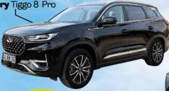
Chery Tiggo 8 Pro