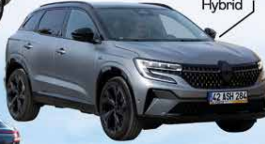
Renault Austral Hybrid