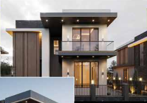
Altın Saray Villaları