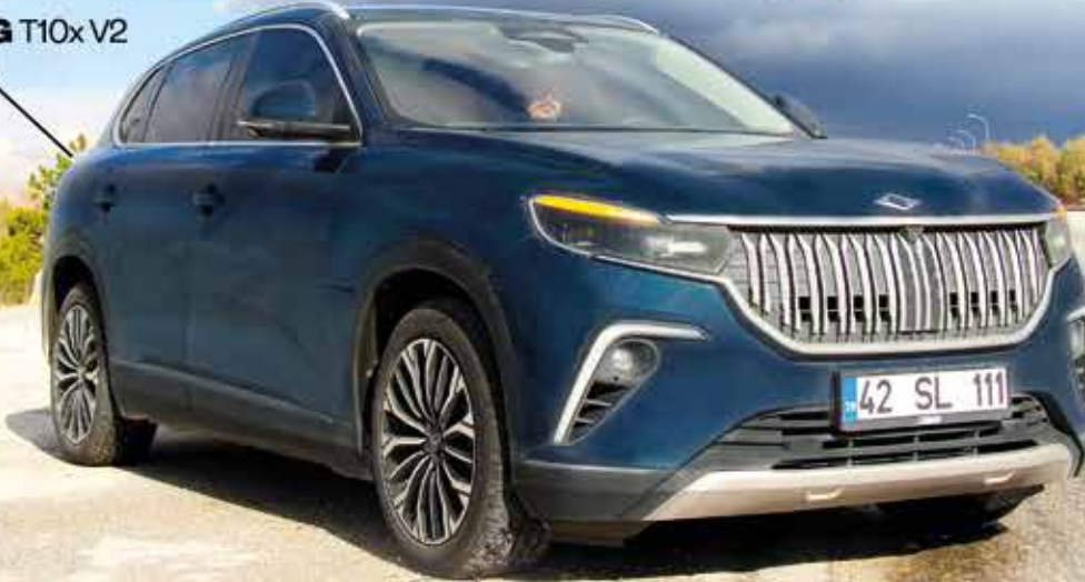
TOGG T10x V2