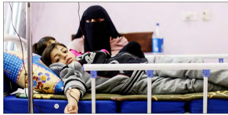
"GAZZE ACIL SAĞLIK YARDIMI KAMPANYASINI BAŞLATIYORUZ"