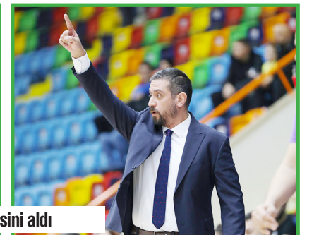
Konyaspor Basketbol, ligde üst üste üçüncü yenilgisini aldı