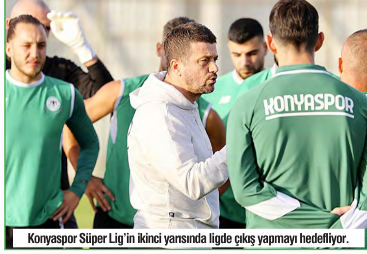
Konyaspor Süper Lig'in ikinci yarısında ligde çıkış yapmayı hedefliyor.