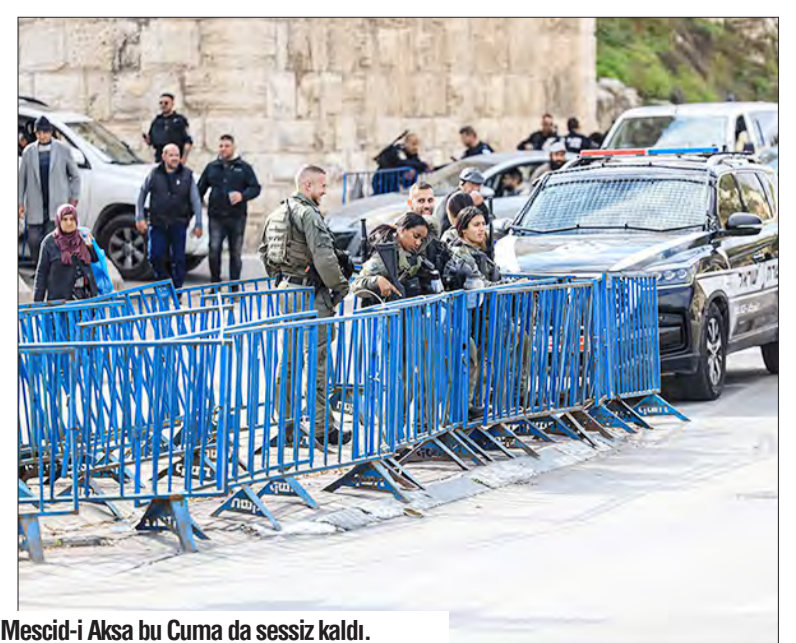
İsrail güçlerinin kısıtlamaları nedeniyle Mescid-i Akşa bu Cuma da sessiz kaldı.