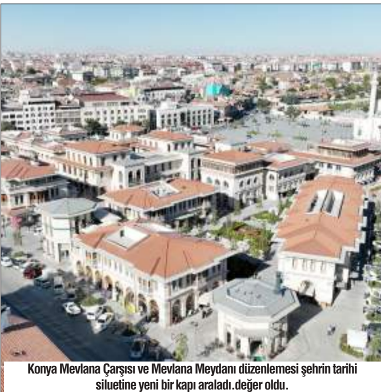
Konya Mevlana Çarşısı ve Mevlana Meydanı düzenlemesi şehrin tarihi silüetine yeni bir kapı araladı. Değer oldu.