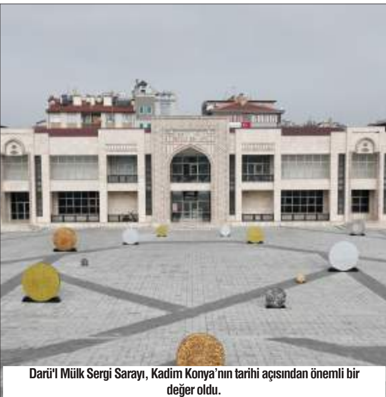
Darü'l Mülk Sergi Sarayı, Kadim Konya'nın tarihi açısından önemli bir değer oldu.