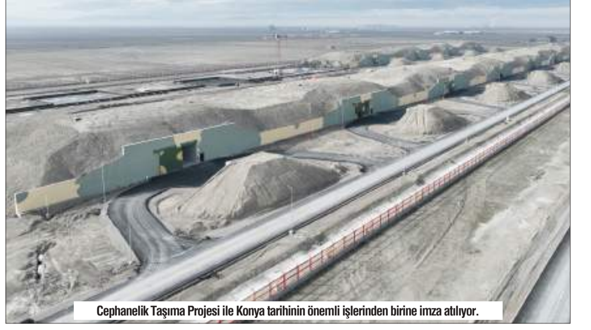
Cephanelik Taşıma Projesi ile Konya tarihinin önemli işlerinden birine imza atılıyor.

Konya Büyükşehir Belediye Başkanı Uğur İbrahim Altay, "Cumhuriyetimizin 100'üncü yılını kutladığımız bu dönemde Konya'mızı ülkemizin en önemli itici gücü haline getirmek için büyük çaba sarf ediyoruz" dedi