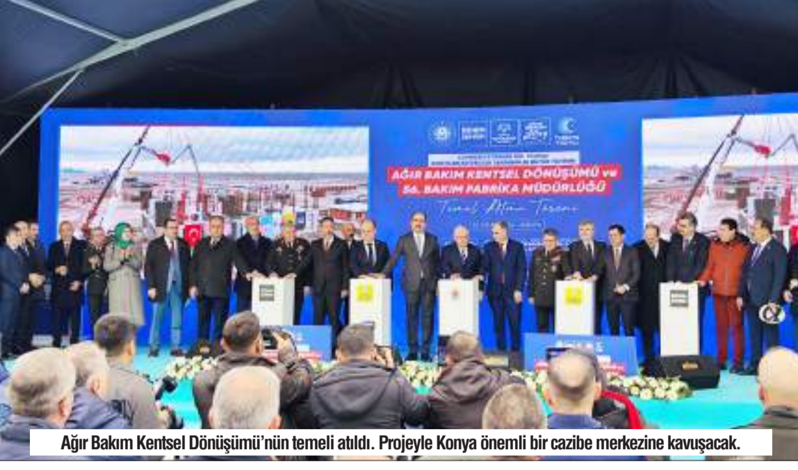
Ağır Bakım Kentsel Dönüşümü'nün temeli atıldı. Projeyle Konya önemli bir cazibe merkezine kavuşacak.