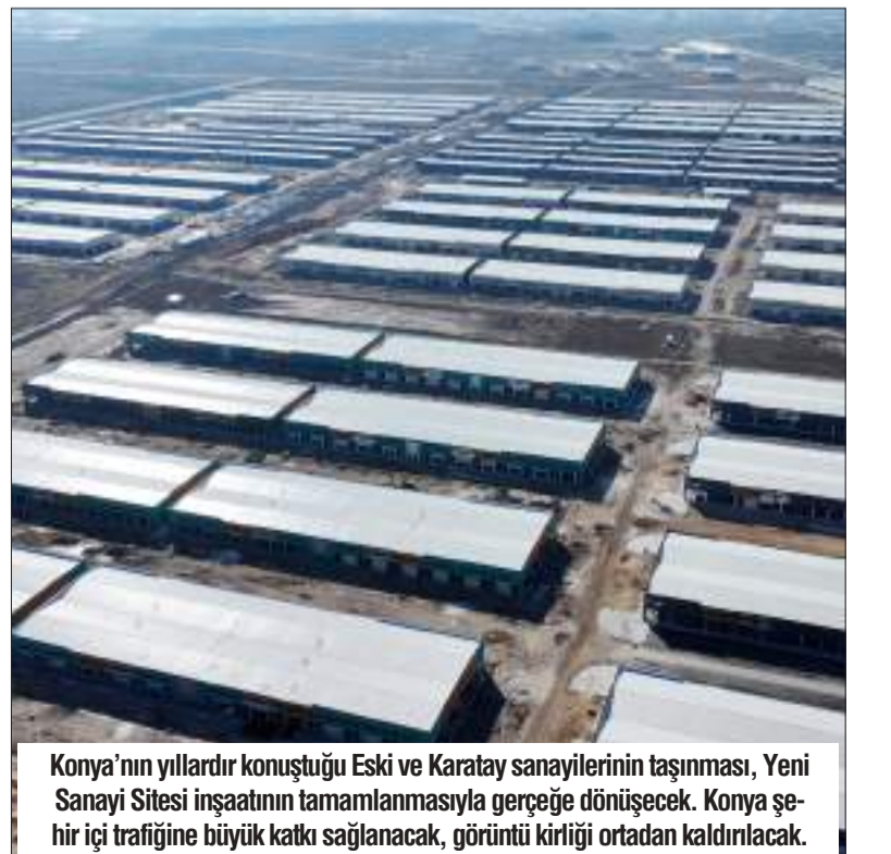
Konya'nın yıllardır konuştuğu Eski ve Karatay sanayilerinin taşınması, Yeni Sanayi Sitesi inşaatının tamamlanmasıyla gerçeğe dönüşecek. Konya şehir içi trafiğine büyük katkı sağlanacak, görüntü kirliliği ortadan kaldırılabilecek.