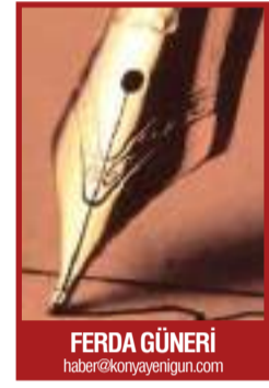
FERDA GÜNERİ haberkonyayenigun.com

Bir ölüp, bin dirilenler, Hz. Mevlâna mana alemine, Göçtü, vuslata erdi, hasreti son buldu, Lâkin, yeniden Mevlâna'lar olacaktır.