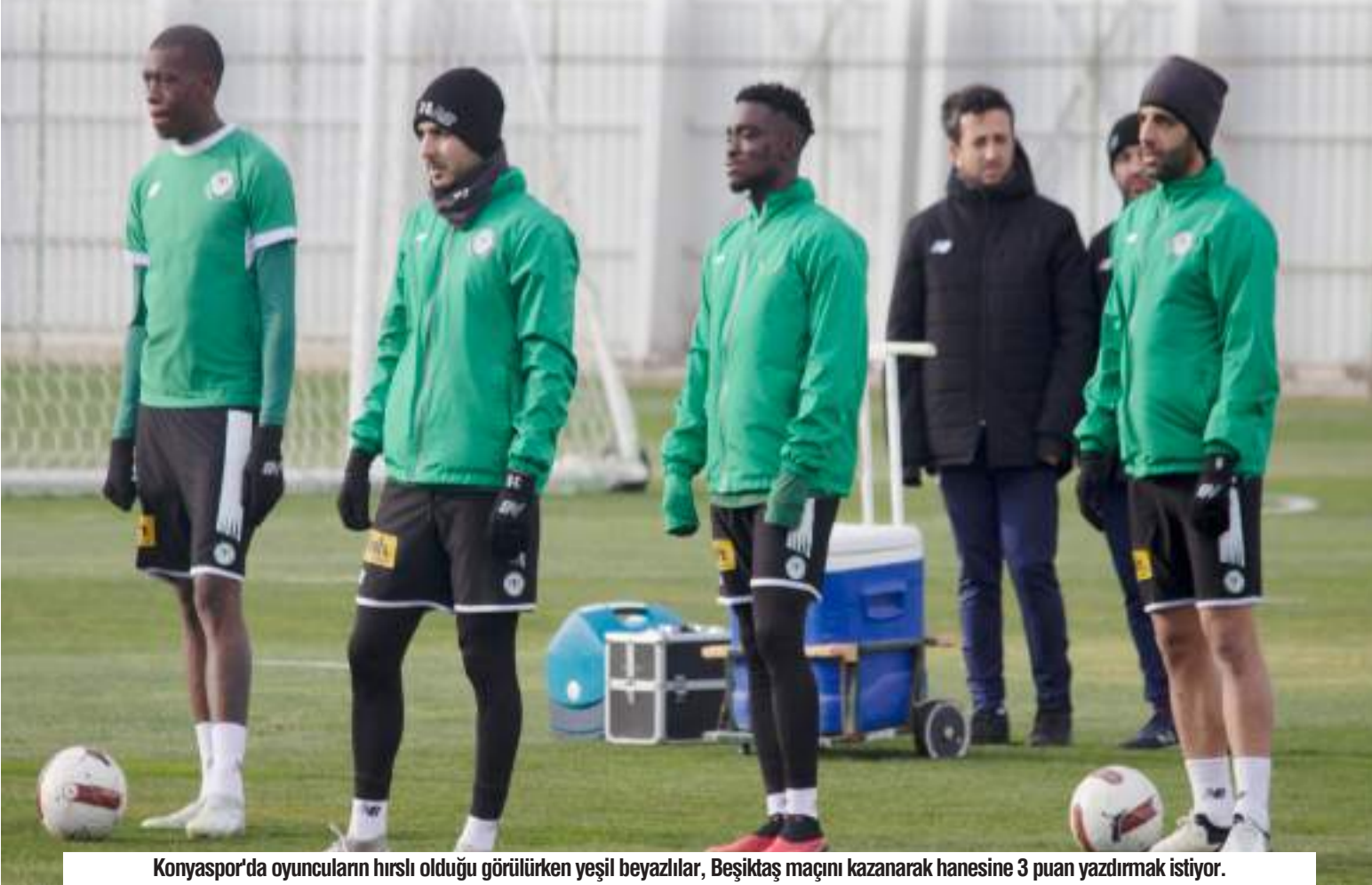
Konyaspor'da oyuncuların hırslı olduğu görülürken yeşil beyazlılar, Beşiktaş maçını kazanarak hanesine 3 puan yazdırmak istiyor.