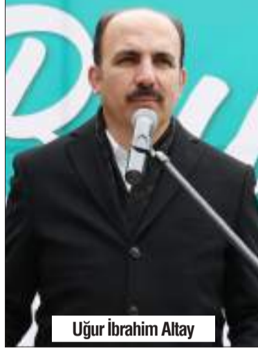
Uğur İbrahim Altay