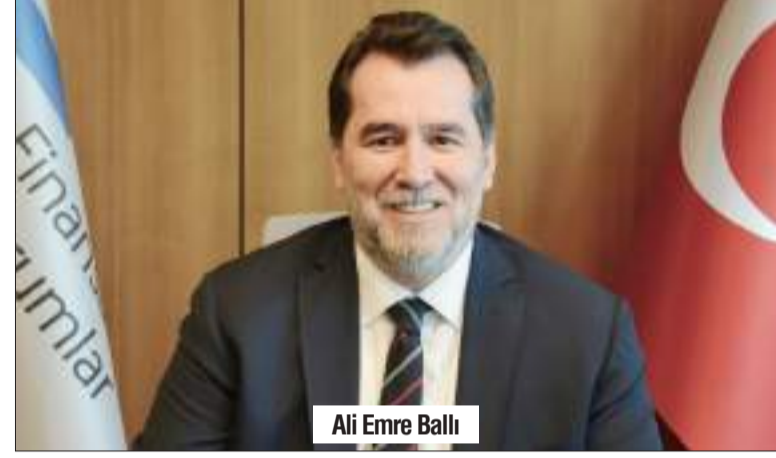
Ali Emre Ballı

Finansal Kurumlar Birliği (FKB) Finansal Kiralama, Faktoring, Finansman, Varlık Yönetim ve Tasarruf Finansman Şirketleri'nin 2023 yılına ilişkin konsolide verilerini açıkladı. FKB'nin temsil ettiği beş sektörün 2023 yılı konsolide verilerine göre; işlem hacmi 1 trilyon 220 milyar TL, aktif toplamı 671 milyar TL, öz kaynak büyüklüğü 111 milyar TL olarak gerçekleşti. Finansal Kurumlar Birliği'nin temsil ettiği sektörlerle yönelik değerlendirmelerde bulunan Finansal Kurumlar Birliği Başkanı Ali Emre Ballı; "Geride bıraktığımız dört yıl boyunca küresel çapta yaşanan salgın ekonomisinin zorlayıcı etkileriyle mücadele ettik. Ardından ülkemizi derinden sarsan deprem felaketiyle sarsıldık. Ancak, tüm bu zorluklara rağmen, Finansal Kurumlar Birliği çatısı altında bir araya gelen Finansal Kiralama, Faktoring, Finansman Şirketleri, Varlık Yönetim Şirketleri ve Tasarruf Finansman Şirketleri olarak, 'Birlikten Kuvvet Doğar' mottoyla hareket ettik ve büyüme hedeflerimize kararlılıkla ilerledik. Cumhuriyetimizin