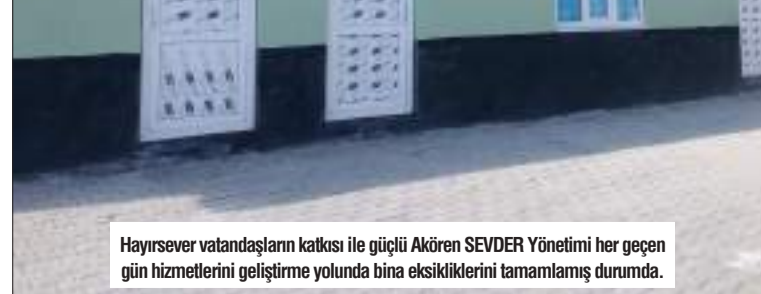
Hayrsever vatandaşların katkısıyla güçlü Akören SEVDER Yönetimi her geçen gün hizmetlerini geliştirme yolunda bina eksikliklerini tamamlamış durumda.