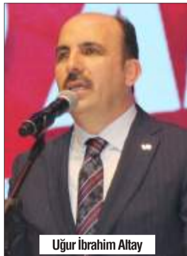
Uğur İbrahim Altay