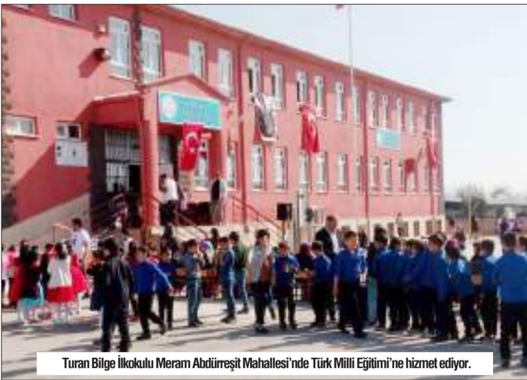
Turan Bilge İlkokulu Meram Abdürreşit Mahallesi'nde Türk Milli Eğitimi'ne hizmet ediyor.