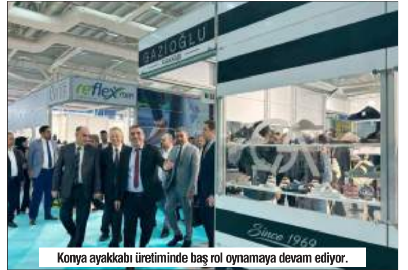
Konya ayakkabı üretiminde baş rol oynamaya devam ediyor.