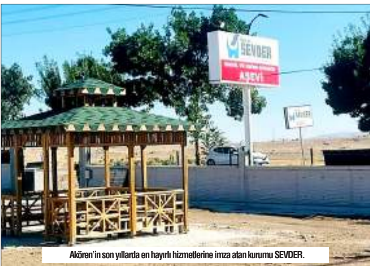
Akören'in son yıllarda en hayırlı hizmetlerine imza atan kurumu SEVDER.