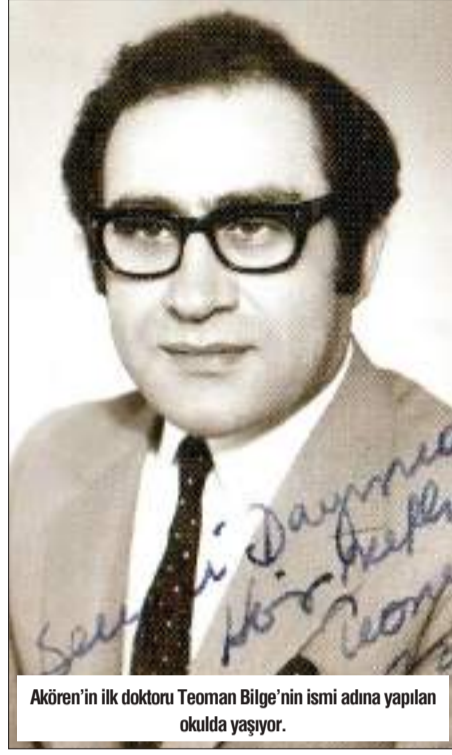
Akören'in ilk doktoru Teoman Bilge'nin ismi adına yapılan okulda yaşıyor.