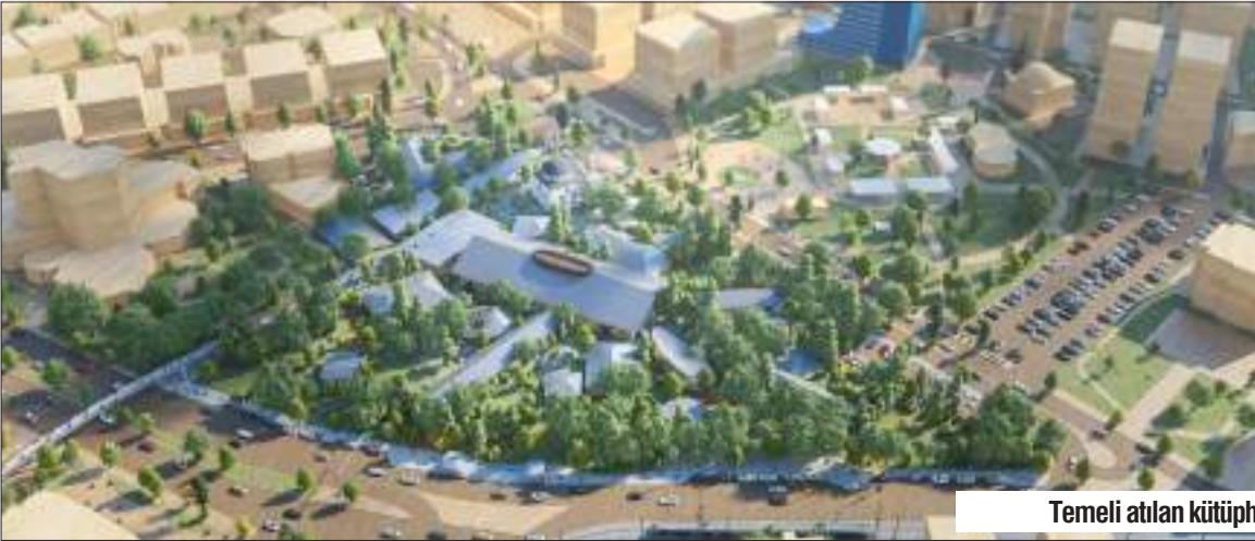
Temeli atılan kütüphanenin proje görüntüleri.