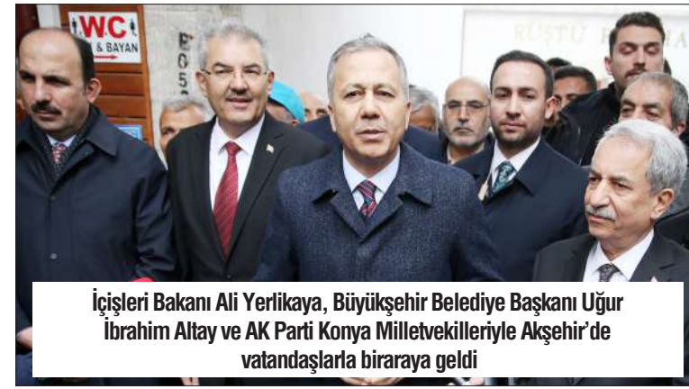
İçişleri Bakanı Ali Yerlikaya, Büyükşehir Belediye Başkanı Uğur İbrahim Altay ve AK Parti Konya Milletvekilleriyle Akşehir'de vatandaşlarla bir araya geldi

Cumhurbaşkanı Recep Tayyip Erdoğan'ın, 1994'te gerçek belediyeçiliği İstanbul'da gösterdiğini vurgulayan Yerlikaya, "Bunu Türkiye'de ilk önce yakalayan belediye de hiç şüphesiz Konya belediyeçiliği oldu. Konya'da gerçek belediye-