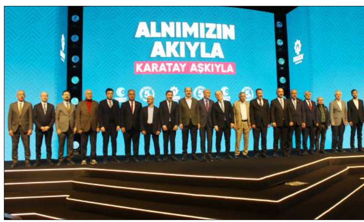
ALNIMIZIN AKIYLA KARATAY AŞKIYLA