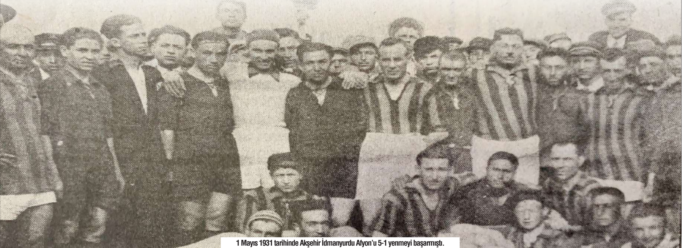
1 Mayıs 1931 tarihinde Akşehir İdmanyurdu Afyon'u 5-1 yenmeyi başarmıştı.