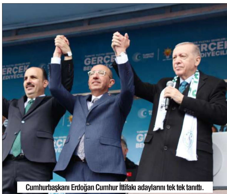
Cumhurbaşkanı Erdoğan Cumhur İttifakı adaylarını tek tek tanıttı.