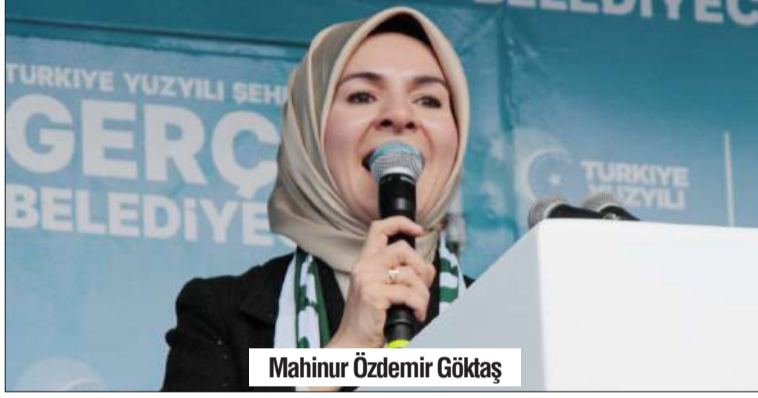
Mahinur Özdemir Göktaş

sağlığı hastanesinden birinin Konya'da yapılacağı müjdesini veren Koca, bin yatak kapasiteli şehir hastanesi konseptli bir hastanesinin de Meram Millet Bahçesi karşısındaki askeri alana yapılacağını belirterek bu yıl içerisinde çalışmaların başlayacağını söyledi.