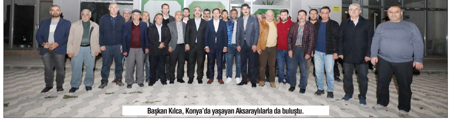
Başkan Kılca, Konya'da yaşayan Aksaraylılarla da buluştu.

Karatay Belediye Başkanı ve Başkan Adayı Hasan Kılca, Konya'da yaşayan Aksaraylılarla da buluştu. Eski Kültür, Eğitim ve Dayanışma Demeği ziyaretinde Konya'nın tüm kesimleriyle büyük bir birlik ve beraberlik içinde olduğunu altını çizen Başkan Hasan Kılca; "Her yönüyle önemli bir şehre hizmet etmek bizleri mutlu ve gururlu kıyor" dedi. ■ HABER MERKEZİ