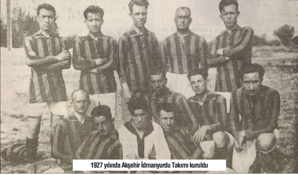
1927 yılında Akşehir İdmanyurdu Takımı kuruldu