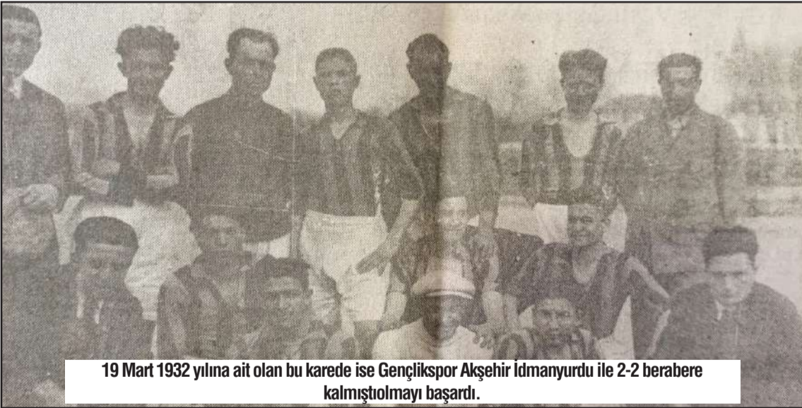
19 Mart 1932 yılına ait olan bu karede ise Gençlikspor Akşehir İdmanyurdu ile 2-2 berabere kalmıştı olmayı başardı.