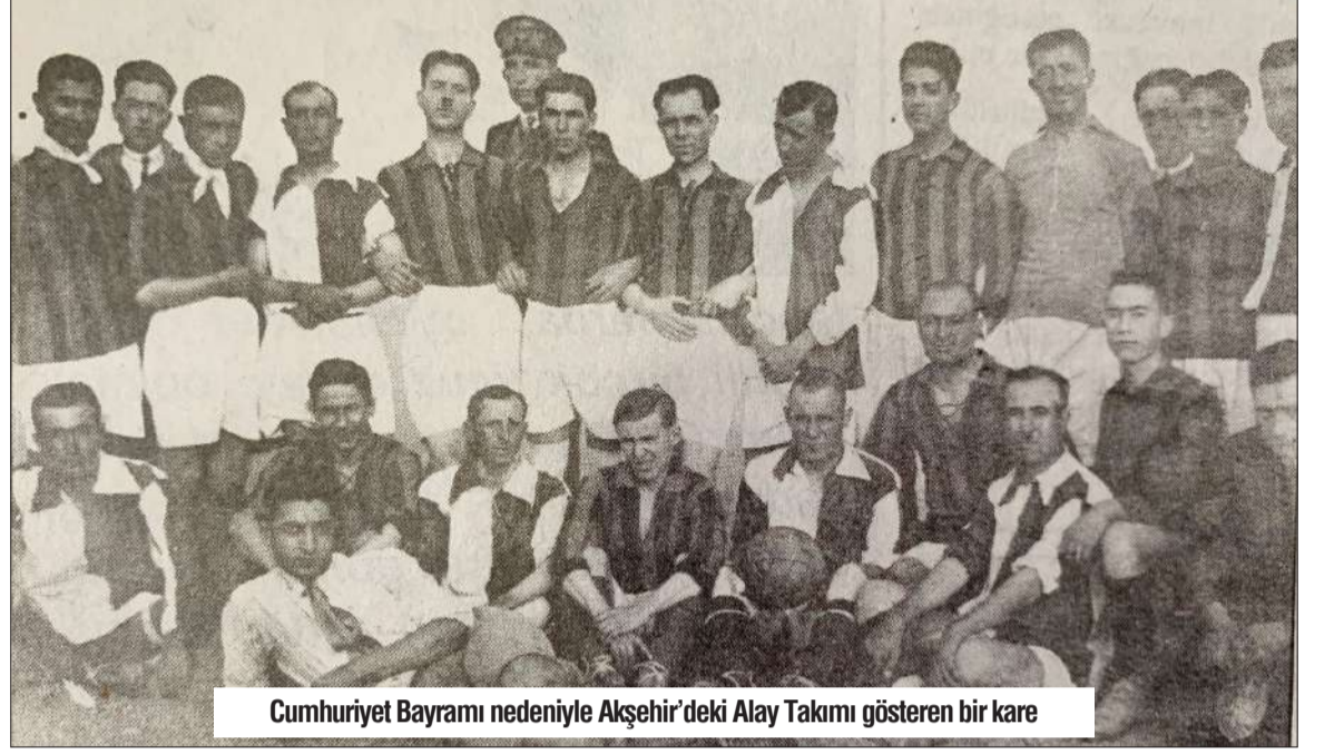
Cumhuriyet Bayramı nedeniyle Akşehir'deki Alay Takımı gösteren bir kare