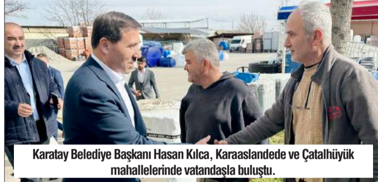
Karatay Belediye Başkanı Hasan Kılca, Karaaslandede ve Çatalhöyük mahallelerinde vatandaşla buluştu.

mensuplarımızla birlikte vatandaşlarımızı ziyaret ederek Karatay'ımızın her köşesinde hemşehrilerimizle bir arada oluyoruz. Bugün de Karaaslandede ve Çatalhöyük Mahallelerimizde, Karatay'ın geleceği için yapacağımız çalışmaları, pro-