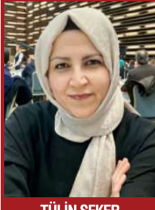
TÜLİN ŞEKER haber.konyayenigun.com

Özellikle İslam'da mukabele, dua veya ibadetlerin topluluk içinde karşılıklı olarak okunmasını belirler. Ramazan ayında yapılan Kuran tilavetleri ve cemaatle gerçekleştirilen dualar, mukabele kapsamında değerlendirilir. Bu uygulama, dini bir topluluk olarak bir araya gelme ve ibadet etme anlayışını temsil eder.