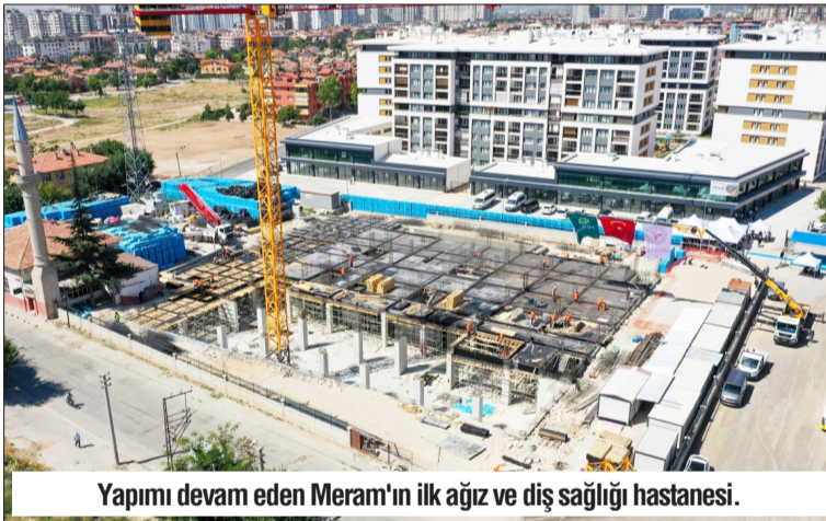
Yapımı devam eden Meram'ın ilk ağız ve diş sağlığı hastanesi.