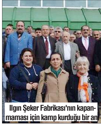
Ilgın Şeker Fabrikası'nın kapanmaması için kamp kurduğu bir an

projeler hakkında bilgi veren Kvasoğlu, "Sosyal hayatta ve Meclis'te çok sevilen, adaleti ile anılan bir insan olan babam, parti gözetmeksizin insanların istediklerini dinlerdi. Devlette çok büyük sorumluluklar aldı. Özellikle son Milli Savunma Bakanlığında 'Milletim bana yetki verdi, ben de ölene kadar hizmet etmeliyim' felsefesini