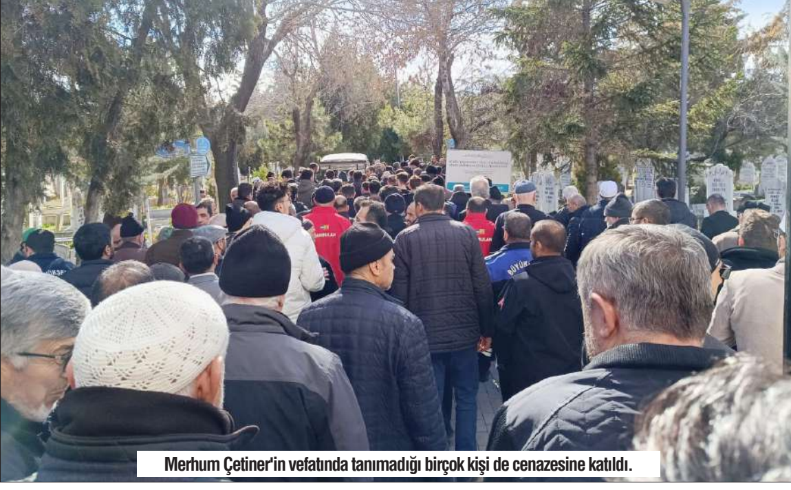
Merhum Çetiner'in vefatında tanımadığı birçok kişi de cenazesine katıldı.