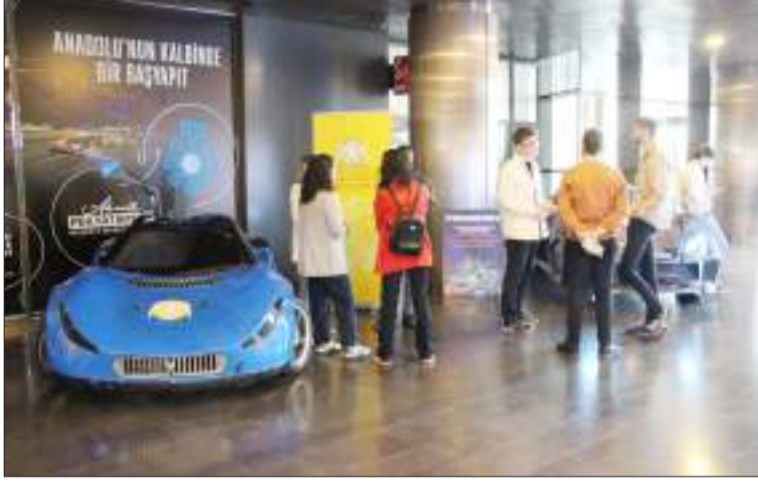
394 robot yarışıyor.