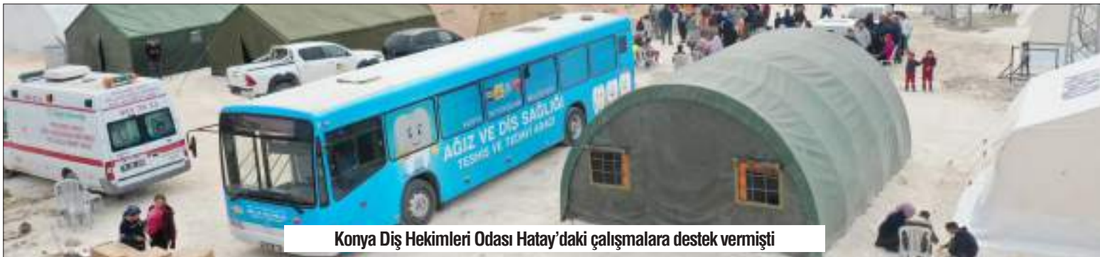
Konya Dış Hekimleri Odası Hatay'daki çalışmalara destek vermişti