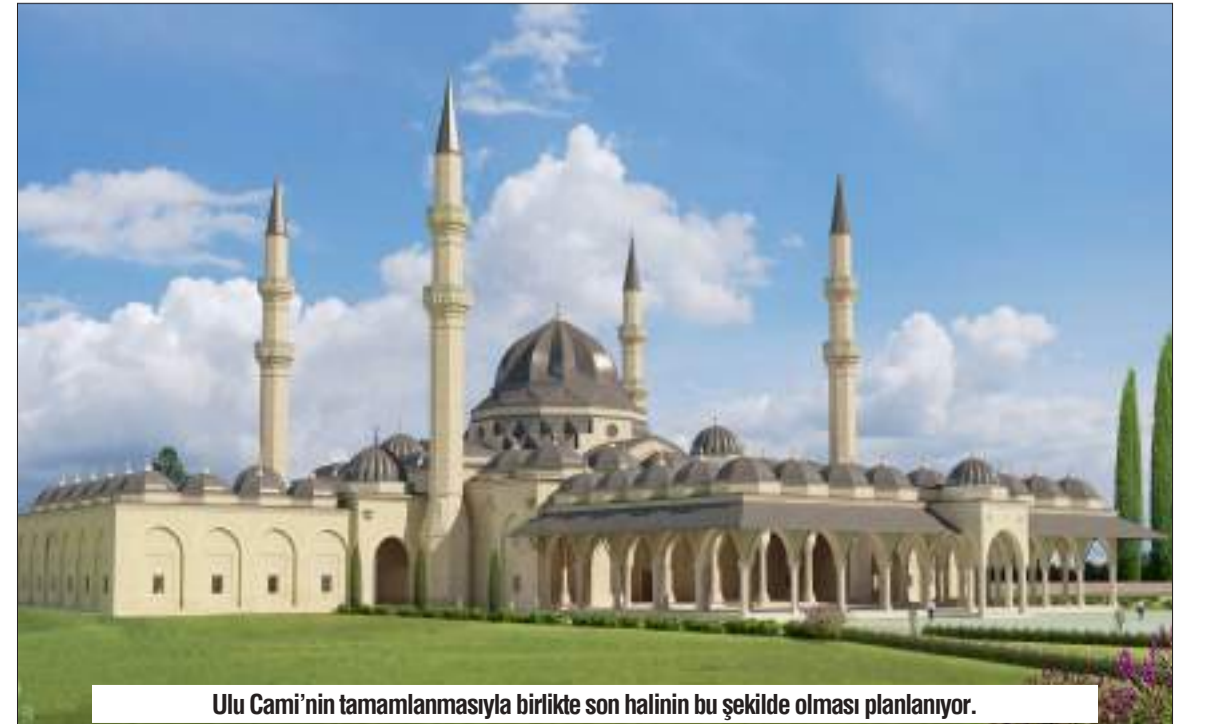
Ulu Cami'nin tamamlanmasıyla birlikte son halinin bu şekilde olması planlanıyor.