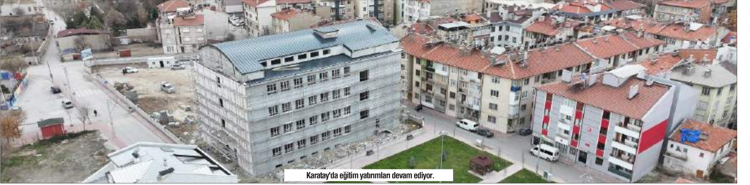
Karatay'da eğitim yatırımları devam ediyor.