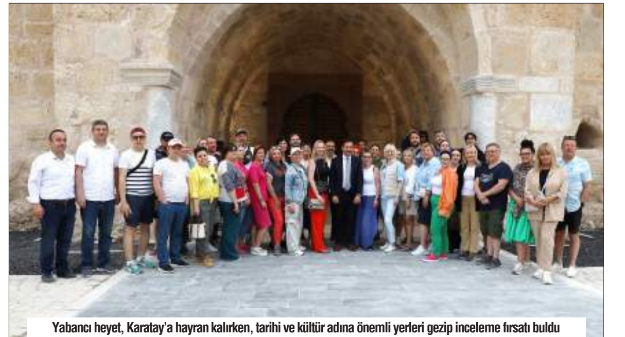
Yabancı heyet, Karatay'a hayran kalırken, tarihi ve kültür adına önemli yerleri gezip inceleme fırsatı buldu