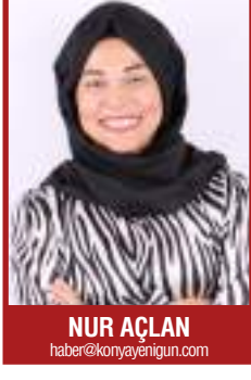
NUR ACLAN haberekonyayenigun.com

Besin gruplarının her birini her öğünde bulundurun. Yemek yeme alış-