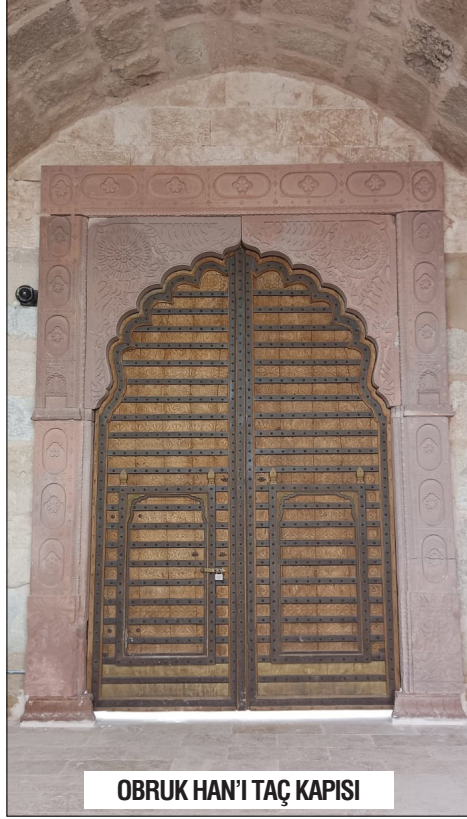
OBRUK HAN'I TAÇ KAPISI

lı olarak yolcuların kaybolan veya ziyan olan mallarını devlet garantisi altına almasıdır.