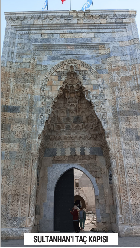
SULTANHAN'I TAÇ KAPISI