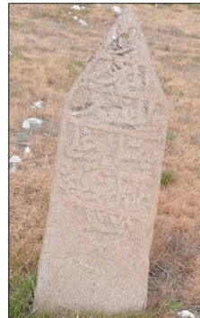
Morhum ve masğurlele nesil oğlu İbrahim Ağanın ruhuna fatiha. 1238 h.