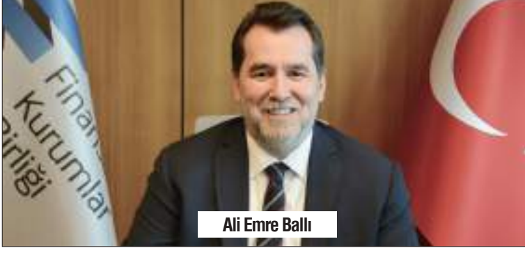
Ali Emre Ballı

Finansal Kurumlar Birliği'nin temsil ettiği sektörler için değerlendirilmelerde bulunan Finansal Kurumlar Birliği Başkanı Ali Emre Ballı; "Finansal Kiralama, Faktoring, Finansman, Varlık Yönetim ve Tasarruf Finansman şirketlerimiz, yılın ilk 6 ayında yakaladıkları büyüme oranlarıyla Türkiye ekonomisine katkı sunmaya devam etti. Bundan 11 yıl önce yola çıkan