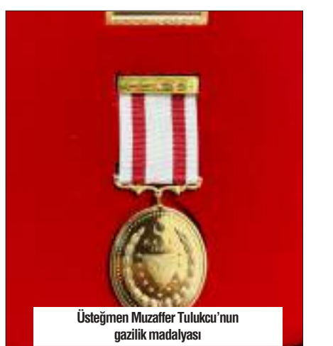
Üsteğmen Muzaffer Tulukcu'nun gazilik madalyası