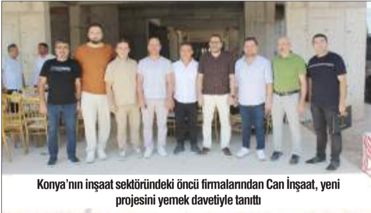
Konya'nın inşaat sektöründeki öncü firmalarından Can İnşaat, yeni projesini yemek davetiyle tanıttı

hendis Ali Can, Toplam 5 bin 384 metrekare arsa alanı üzer-