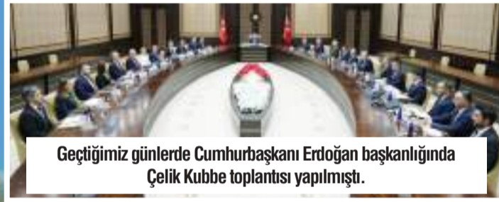
Geçtiğimiz günlerde Cumhurbaşkanı Erdoğan başkanlığında Çelik Kubbe toplantısı yapılmıştı.