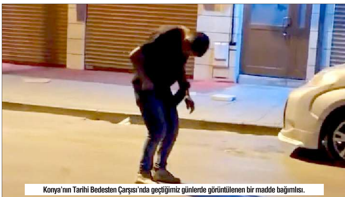
Konya'nın Tarihi Bedesten Çarşısı'nda geçtiğimiz günlerde görüntülenen bir madde bağımlısı.

Madde bağımlılığı çağımızın en büyük sorunlarından birisi olarak karşımıza çıkıyor. O yüzde ailelerin çocuklarını hiçbir zaman yalnız bırakmamaları ve arkadaş çevresini yakından tanımaları gerektiğini vurgulayan Yayla, "Gördüğümüz gibi Konya'da bağımlılık arttı. Bunun en temel sebebi internet ortamı ve yanlış çevre seçiminden kaynaklanıyor. O yüzden aileler, 'benim çocuğum nasıl olsa bulaşmaz' demesinler. Madde bağımlısı olduğu için ne beyin cerrahları, avukatlar gördük şu an tedavi gören. Çok dikkatli olunması ve bireyin de bilinçli hareket etmesi gerekiyor. Her şey, 'bir kereden bir şey olmaz' ile başlıyor" diye ekledi. ■ TUBA KAYA