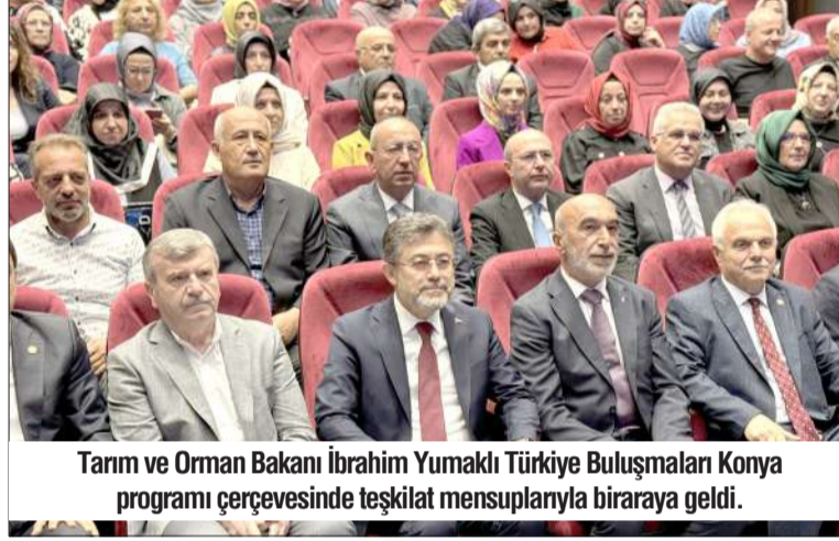
Tarım ve Orman Bakanı İbrahim Yumaklı Türkiye Buluşmaları Konya programı çerçevesinde teşkilat mensuplarıyla biraraya geldi.

"Türkiye'mizin bundan sonraki on yıllarına etki edecek, bundan sonraki nesillerin çok daha iyi üretim yapmasına sebep olacak; verimli, kaliteli, sürdürülebilir tarımsal üretimler için gece gündüz çabalamaya devam ediyoruz. 40 yıldır konuşulan tarımda üretim planlamasını 2024'ün 1 Eylül'ü itibarıyla hayata geçirmiş olduk. 2024 yılı tarımsal ihracat rakamının 35 milyar dolara doğru gittiğini de buradan belirtmek istiyorum. Tarımsal üretim desteklemeleri artık 3 yılına ve üretim sezonu başlamadan