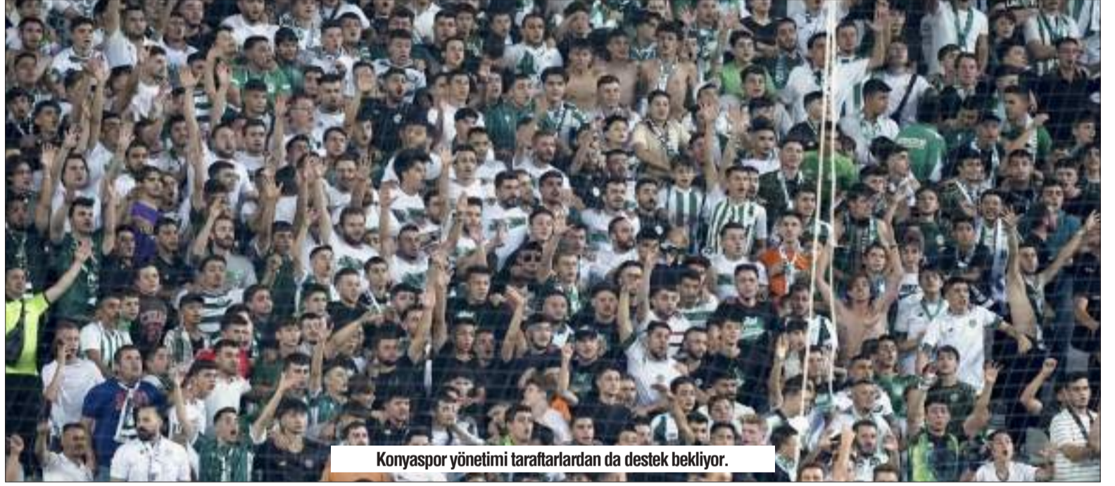
Konyaspor yönetimi taraftarlardan da destek bekliyor.