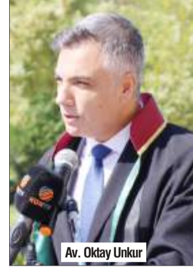
Av. Oktay Unkur

bilinç, barış ve refahın da artacağına olan inancını yenileyen Unkur konuşuyla ilgili şu ifadeleri kullandı: "Adaletin sağlanması için adil yargılanma, adil yargılanma içinse bağımsız yargı ve etkili kullanılacak bir savunma hakkı şarttır. Savunma ayağı eksik veya güçsüz bırakılarak adalet tesis edilemez. Savunma hakkının temsilcisi olan avukatlık mesleğinin sorunları görmezden gelinerek yurttaşların adalet talebine karşılık verebilmek müm-