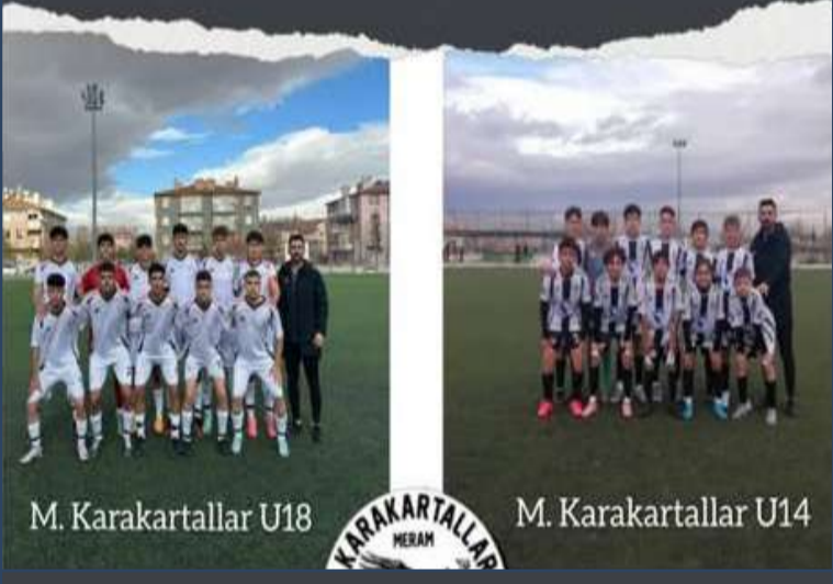
M. Karakartallar U18