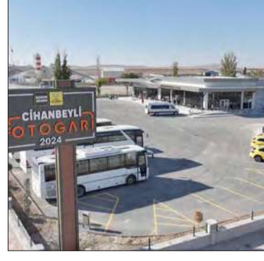
tesis ilçemizin ulaşım kapasitesini artırmakla kalmayacak; aynı