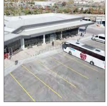
zamanda bölgenin ekonomisine, sosyal hayatına ve gelişimine de katkı sunacak. Cihanbeyli Otoparkımızın, ilçemize ve şehrimize hayırlı olmasını temenni ediyorum" ifadelerini kullandı.

Yeni Cihanbeyli Otoparkı; bilet satış gişeleri, peronlar, idari ofisler, kafeterya, büfe, berber dükkanı, hediyelik eşya dükkanı, kilimli emanet dolapları, bebek bakım odası, bay-bayan mescitler, ticari taksi durağı, 36 araçlık otobüs park alanı, vezne ve kontrol noktasından oluşuyor.