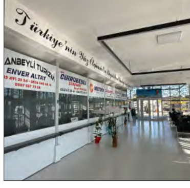
mizin her türlü ihtiyacına cevap verecek şekilde tasarlandı. Yeni

Vatandaşların ulaşım ihtiyaçlarını daha modern ve konforlu bir ortamda karşılamalarını sağlamak amacıyla ilçelere yeni otopark binaları kazandırdıklarını kaydeden Başkan Altay, "Akşehir, Bozkır ve Hüyük'ten sonra Cihanbeyli ilçemize kazandırdığımız yeni otopark binamız hizmet vermeye başladı. Yaklaşık 6 bin metrekare alanda inşa edilen terminal binamız, hemşehrileri-